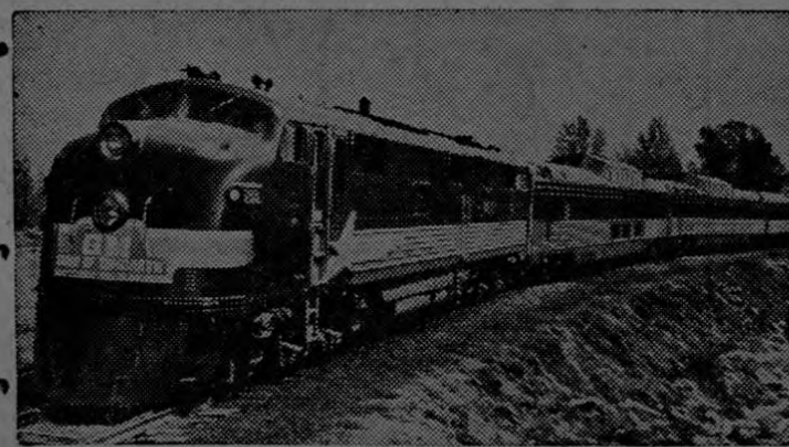
Arribó a San José el primer tren cargado de